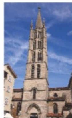
Eglise St Michel des Lions à Limoges: Reconnue au titre de Basilique mineure

La Messe chrismale sera célébrée le mardi 4 avril à la collégiale de St Léonard