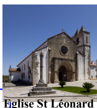
Eglise St Léonard

Dieu nous révèle le mystère de son amour par l'envoi de son Fils et du Saint-Esprit. Jésus nous révèle que Dieu est « Père », en nous montrant d'une façon unique et originale, que Lui-même n'existe que par son Père. Jésus est un seul Dieu avec le Père. Jésus a promis à ses apôtres – les douze hommes qu'Il a choisis et envoyés – le don de l'Esprit Saint. Il sera avec eux et en eux pour les instruire et les conduire « vers la vérité tout entière » (Jean 16, 13).